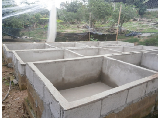
Figura 2. Estanques de cemento construidos para el desarrollo del experimento.

experimentales del estudio; de 1,5 m de largo por 1,6 m de ancho, con una altura de 50 cm, a los mismos que se le adicionó una película de agua dulce de 10 cm (Figura 2).