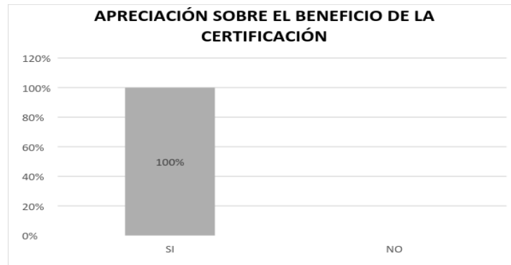
Figura 4. Beneficio de la certificación Fair Trade

En los procesos de exportación realizados por la organización UROCAL se observa las siguientes actividades de exportación: