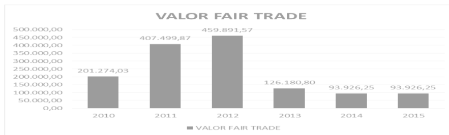
Figura 3. Exportaciones de Cacao con Certificación Fair Trade

Mediante el estudio que se realizó en la provincia de El Oro, se obtuvo como resultado una organización que aplica un proceso de producción y calidad mediante certificación de Fair Trade como es el caso de la Organización Unión Regional de Organizaciones Campesinas del Litoral (UROCAL), ubicada en la Ciudad de Machala, está registrada en la Coordinación Ecuatoriana de Comercio Justo, perteneciendo a la Unión Nacional de asociaciones de pequeños productores.