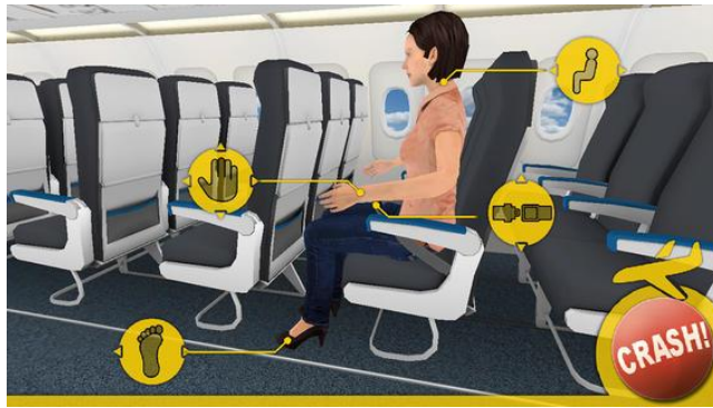
Figura 1. Learn to Brace. Screen de iPhone del área en donde desarrolla el juego.