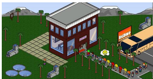
Figura 4. Inicio del simulador del juego, en donde se puede construir el hotel