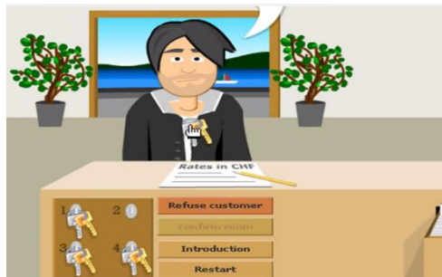
Figura 2. El juego posee instrucciones para facilitar el desarrollo del juego

Existen simuladores de distintas situaciones; los cuales pretenden enseñar mediante las diferentes misiones, sobre la administración de una empresa. Este simulador de hotel, permite al usuario, realizar las tareas de un recepcionista, tales como; realizar check-in, atender a reclamos, entre otras actividades.