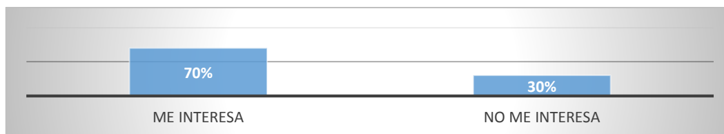
Figura 1. Porcentaje de estudiantes que interesan y no interesa una carrera profesional.

A continuación se muestra de manera porcentual los resultados del test aplicado a los 350 estudiantes de 2do y 3er año de Bachillerato en Centros Educativos de la ciudad de Azogues, la misma que generó resultados relevantes para determinar sus intereses vocacionales.