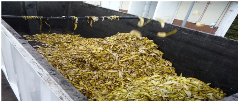
Figura 1. Cáscaras de banano maduro que se generan el proceso de deshidratación.

En este contexto, la Provincia de El Oro, posee grandes extensiones de tierras agrícolas dedicadas al cultivo de banano, donde las frutas "rechazadas" que no cumplen los indicadores de calidad para su exportación son aprovechadas de diversas maneras. Uno de los destinos de esta materia prima es la empresa CONFOCO S.A. que tiene su Planta de procesamiento ubicada en la Parroquia La Peaña en el cantón Pasaje de la Provincia de El Oro, donde se obtienen entre otros productos harina (flake) y puré de banano, que genera alrededor de 315 toneladas métricas por semana de cáscara de banano maduro (Figura 1).