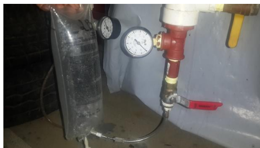
Figura 3. Dispositivo de propileno utilizado para medir el volumen de CO 2 generado por la cáscara de banano maduro.

Tres veces al día se midió el volumen de CO 2 generado por la cáscara de banano madura, para lo cual se utilizó una bolsa de propileno (Figura 3) como sistema de muestreo.