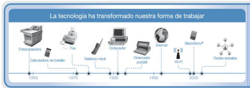
Figura I: Evolución de la tecnología

“Las TIC’s están presente en todos los niveles de nuestra sociedad actual, desde las más grandes corporaciones multinacionales, las pymes, gobiernos administraciones, universidades, centros educativos, profesionales y particulares”. (Suárez, 2010).