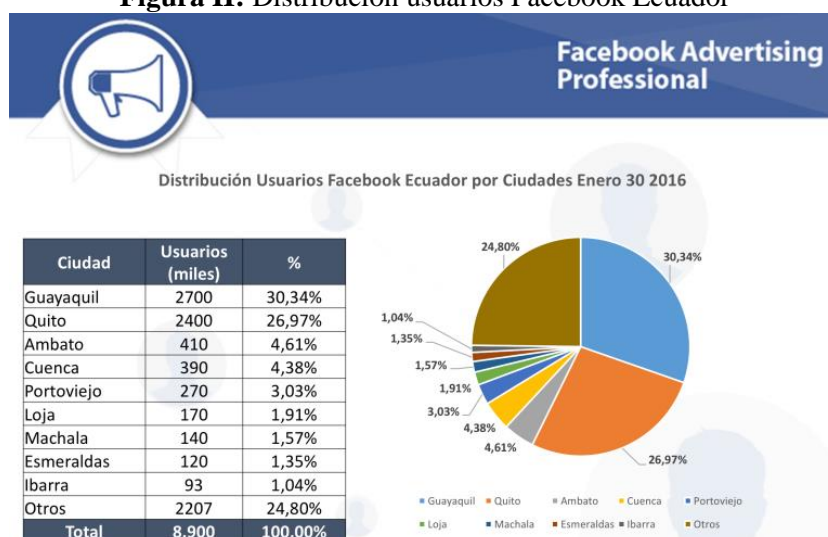
Figura II: Distribución usuarios Facebook Ecuador

Dentro de las ciudades con mayor población de empresas en redes sociales podemos situar a Guayaquil en el primer lugar, seguidos por Quito y Cuenca.