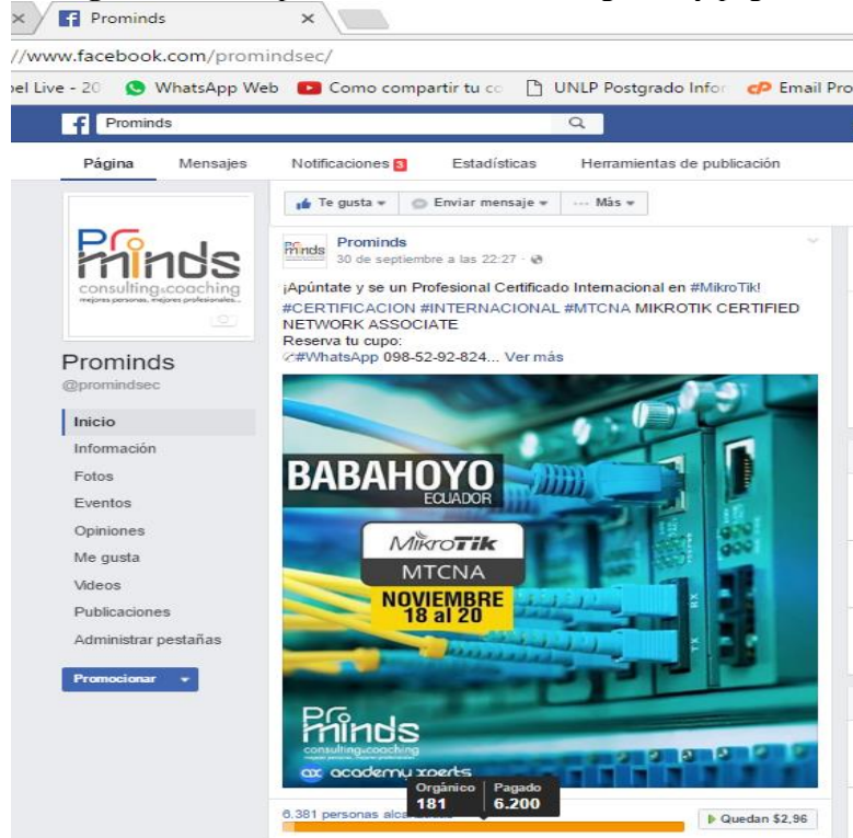
Figura III: Comparación entre alcance orgánico y pagado