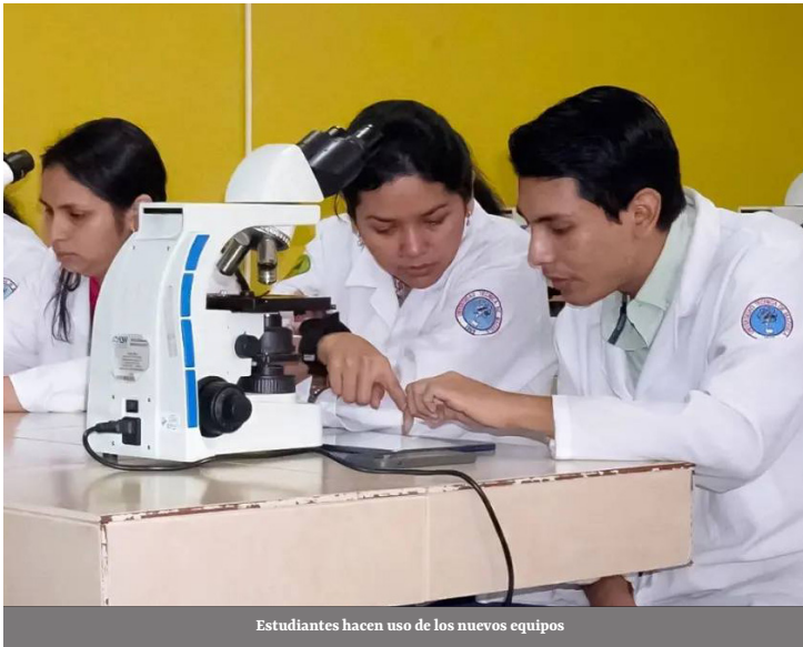
Estudiantes hacen uso de los nuevos equipos