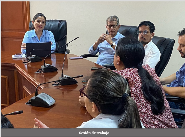
Sesión de trabajo