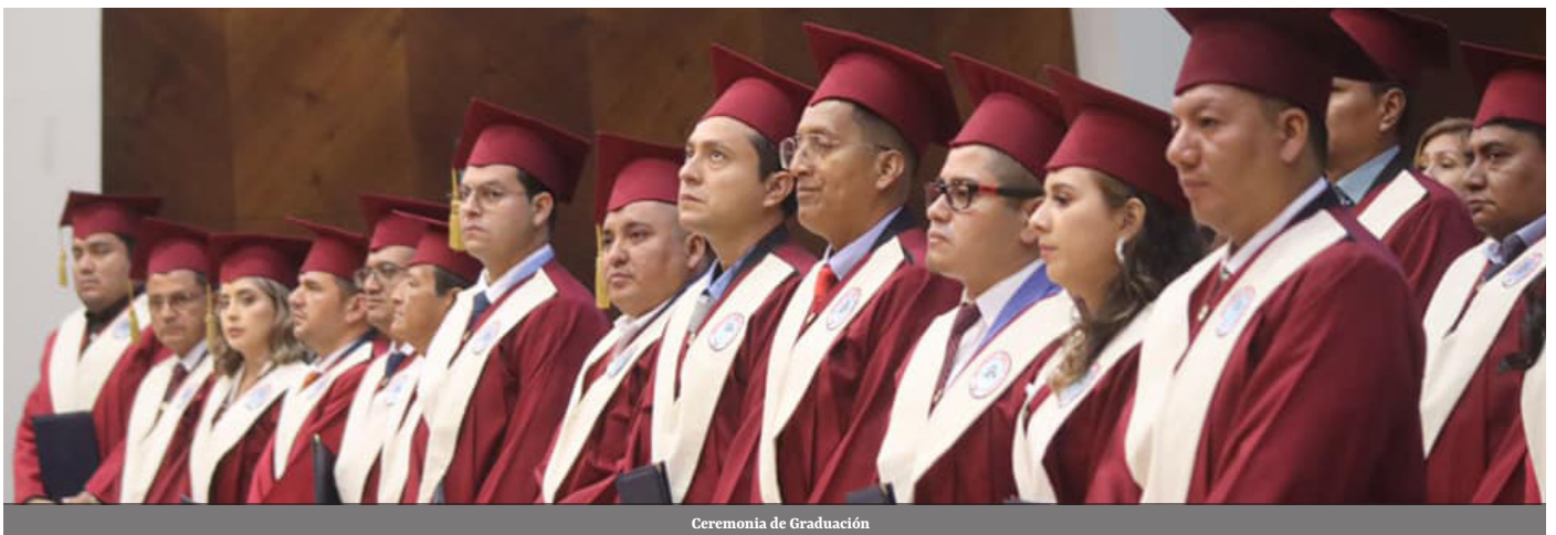
Ceremonia de Graduación

Estudiantes de Posgrado en las especialidades: Maestría en Agronomía con mención en Producción Vegetal; Recursos Naturales Renovables; y Derechos y Justicia Constitucional culminaron sus estudios en una emotiva ceremonia en la que participaron nuestras principales autoridades.