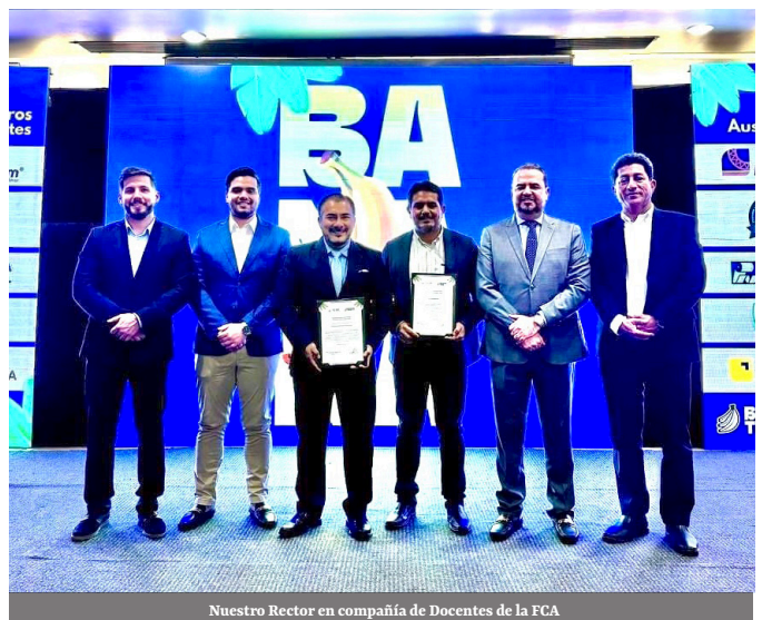
Nuestro Rector en compañía de Docentes de la FCA