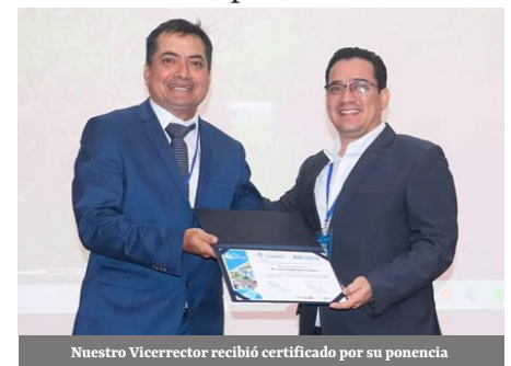
Nuestro Vicerrector recibió certificado por su ponencia

En el evento también se dió la participación de nuestro Vicerrector como conferencista con el tema "Impacto de las variables fiscales en la inversión privada".