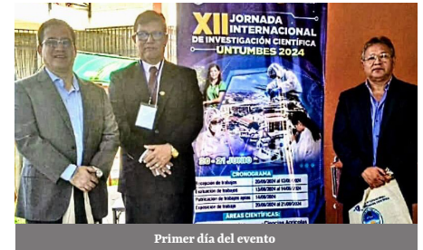
Primer día del evento