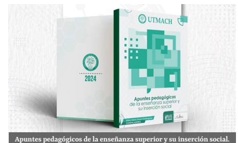
Apuntes pedagógicos de la enseñanza superior y su inserción social.