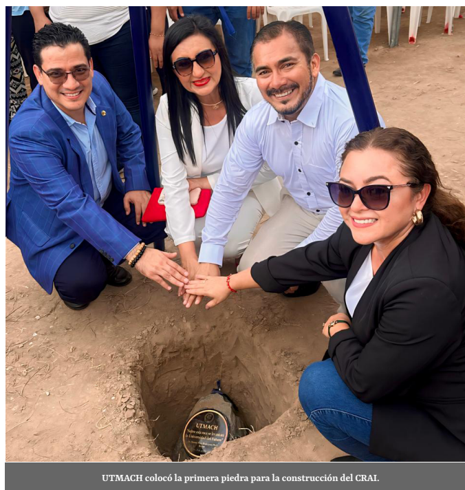
UTMACH colocó la primera piedra para la construcción del CRAI.