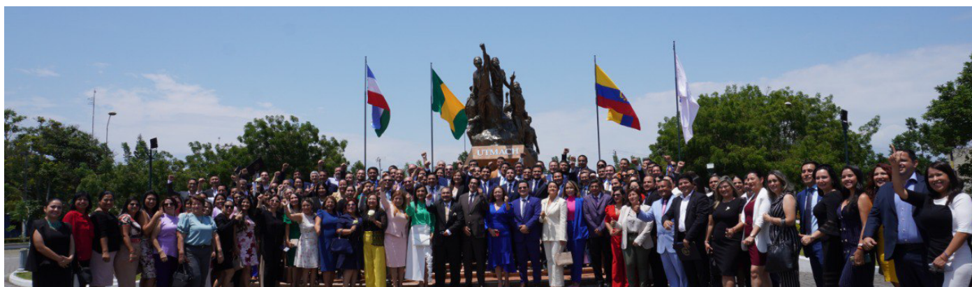
UTMACH celebró los 55 años de creación de vida institucional.

Es un honor celebrar el Quincuagésimo Quinto Aniversario de nuestra querida Alma Máter. En este evento, lleno de solemnidad y gratitud, se reconoció la labor invaluable de todo nuestro equipo. Se hizo especial mención a nuestros distinguidos docentes que han alcanzado el grado de doctorado, un logro que refleja su dedicación y compromiso con la excelencia académica. También se expresó un profundo agradecimiento al personal que ha brindado sus servicios durante más de 25 años, siendo pilares fundamentales de nuestra institución. Se reconoció a nuestros estudiantes, cuyo esfuerzo y responsa-