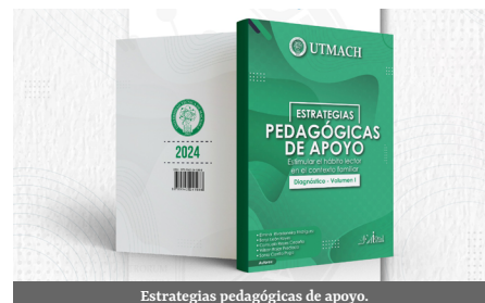
Estrategias pedagógicas de apoyo.