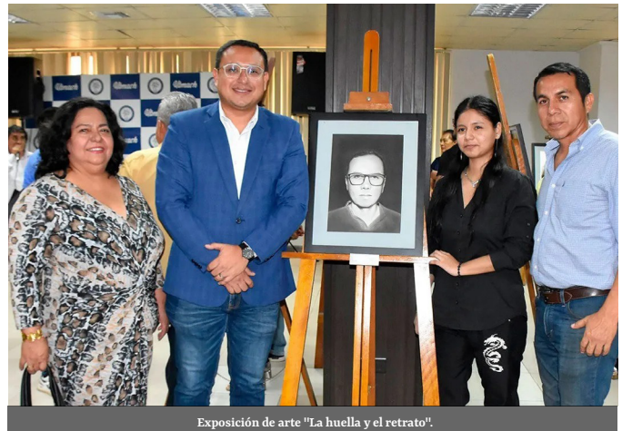
Exposición de arte "La huella y el retrato".

El salón de eventos de la UTMACH se convierte en un escenario de belleza y expresión artística con la emocionante presentación de la exposición colectiva titulada "La huella y el retrato". Esta cautivadora actividad, que estuvo en exhibición hasta el jueves 18 de abril, reunió el talento de estudiantes y docentes de la carrera de Artes Plásticas. En el evento, que contó con la distinguida presencia de la Vicerrectora Académica y autoridades de la Facultad de Ciencias Sociales, se expresaron sinceras felicitaciones a los estudiantes por plasmar sus talentos en los retratos elaborados. Además, se les invitó a seguir generando más espacios académicos y culturales que enriquezcan la vida universitaria. Esta exposición no solo es un reflejo del ta-