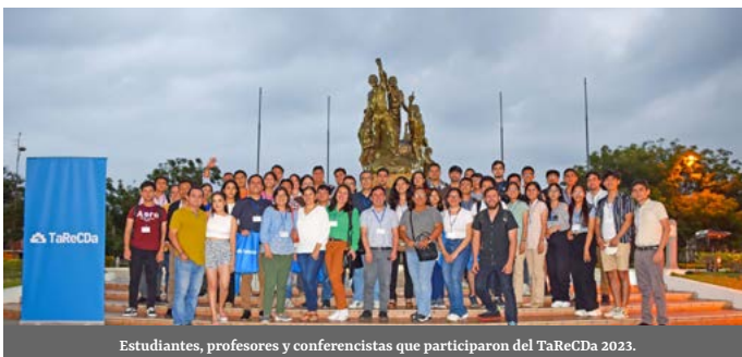
Estudiantes, profesores y conferencistas que participaron del TaReCda 2023.

En un hito significativo para la investigación en Ciencias Computacionales, la Universidad Técnica de Machala (UTMACH), en alianza con la Universidad de Rice (EE.UU.), fue seleccionada por Google Research para organizar el Segundo Taller Regional sobre Aplicaciones e Investigación en Ciencias de Datos (TaReCda), en el marco del programa exploreCSR. Este programa, que promueve la inclusión de estudiantes de grupos subrepresentados en la investigación computacional, busca incrementar su participación en estudios de posgrado y en la esfera investigativa. Los talleres de exploreCSR son una plataforma para que los estudiantes interactúen con reconocidos investigadores y construyan redes con colegas afines.