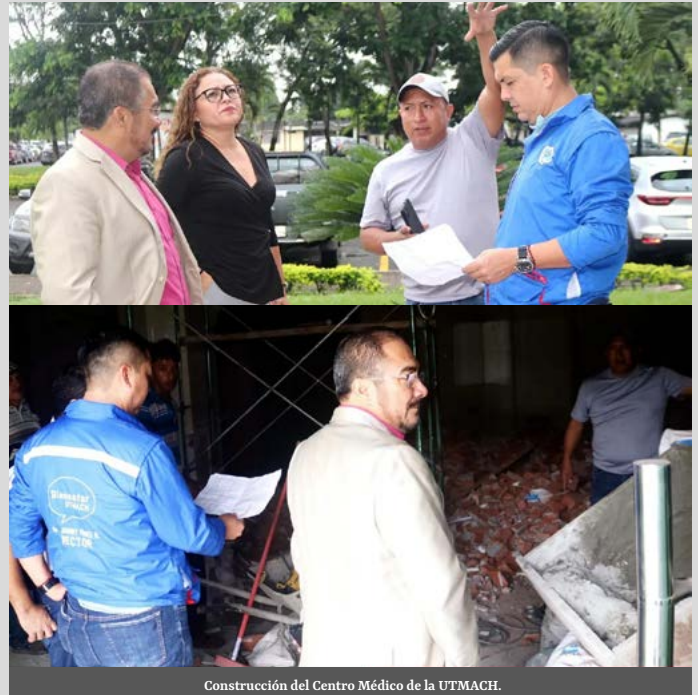
Construcción del Centro Médico de la UTMACH.