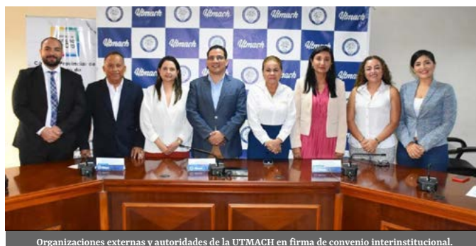
Organizaciones externas y autoridades de la UTMACH en firma de convenio interinstitucional.

El pasado 10 de enero se firmaron convenios con la Dirección Nacional de Registros Públicos, Colegio Ismael Pérez Pazmiño y la Cámara de Turismo de El Oro. Estas cooperaciones fortalecen la vinculación de nuestra institución y reflejan el trabajo en equipo con entidades públicas en beneficio de la comunidad universitaria y sociedad orense.