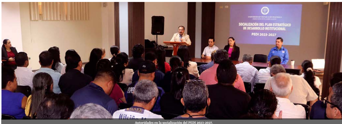
Autoridades en la socialización del PEDI 2023-2027.