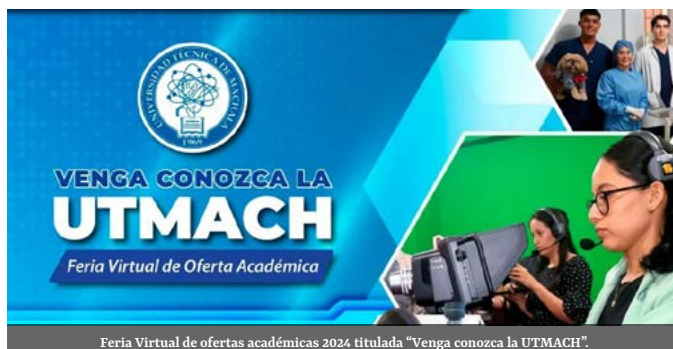
Feria Virtual de ofertas académicas 2024 titulada "Venga conozca la UTMACH".

Plan Estratégico Institucional 2023-2027 (PEDI). En este diálogo se destacó el compromiso que tiene la institución con la mejora continua y la creación de mejores oportunidades académicas para la comunidad universitaria.