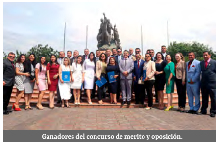
Ganadores del concurso de merito y oposición.

En un acto solemne realizado, el pasado 24 de noviembre, 38 docentes que ganaron Concursos de Méritos y Oposición fueron posesionados por parte de nuestras autoridades. Felicitamos a los catedráticos que ejercerán sus funciones en las distintas Facultades de nuestra institución de educación superior.