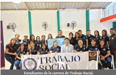
Estudiantes de la carrera de Trabajo Social.