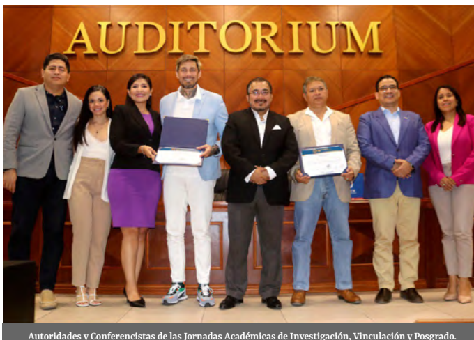
Autoridades y Conferencistas de las Jornadas Académicas de Investigación, Vinculación y Posgrado.

estudiantes a través de ponencias. Continuando con la SEMCI, el día miércoles 29 de noviembre, se llevó a cabo la exposición de los trabajos del Reconocimiento a la Investigación Científica UTMACH, dirigido a estudiantes. Además, autores hicieron la presentación de productos editoriales y a través de unas tertulias doctorales, conocimos las experiencias de varios académicos que han obtenido sus títulos de Ph.D. El día jueves 30 de noviembre, varios grupos de investigación pudieron hacer la presentación de sus resultados, por medio del evento que se denomina "Presentación de proyectos de investigación". Finalmente, el día viernes 1 de diciembre, conocimos a los ganadores del Reconocimiento a la Investigación Científica, en las diferentes categorías y dominios de investigación.