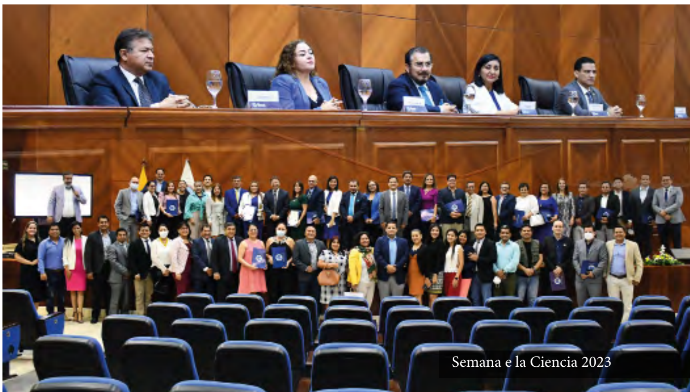
Semana e la Ciencia 2023