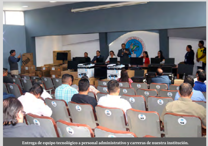
Entrega de equipo tecnológico a personal administrativo y carreras de nuestra institución.

Con una inversión histórica de más de $96.000, el pasado 29 de noviembre, nuestras autoridades entregaron equipos informáticos y tecnológicos a las Coordinaciones de Carrera de nuestra institución, así como a proyectos de investigación y servidores administrativos. Nuestro Rector encabezó la entrega de bienes tecnológicos e instó a todos los beneficiarios a redoblar esfuerzos para alcanzar las metas institucionales, fortalecer la investigación y mejorar la gestión administrativa. En este evento se reafirmó el constante impulso de la universidad hacia el desarrollo integral, promoviendo un entorno educativo moderno y equipando a sus docentes y servidores de modernos implementos para la realización de sus diferentes labores.