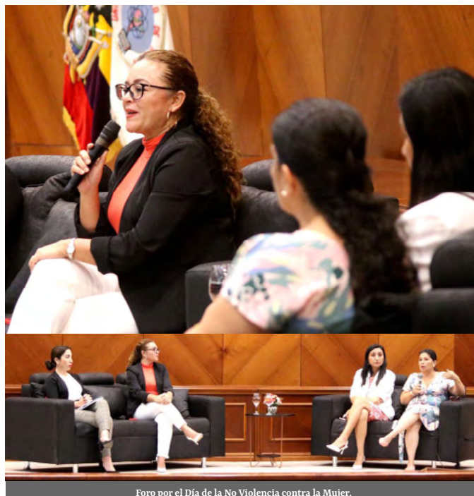
Foro por el Día de la No Violencia contra la Mujer.