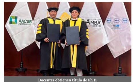
Docentes obtienen título de Ph.D.