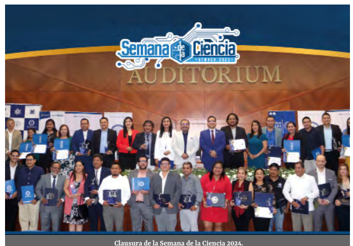
Clausura de la Semana de la Ciencia 2024.