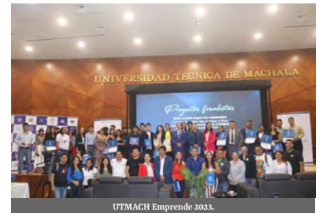
UTMACH Emprende 2023.

tiva del Vicerrectorado de Investigación, Vinculación y Posgrado. Los proyectos ganadores en este primer concurso fueron: 1er lugar: Kits de robótica educativa; 2do lugar: Productos derivados del camarón como alternativa de diversificación; y, 3er lugar: Productos derivados del vino de banano.