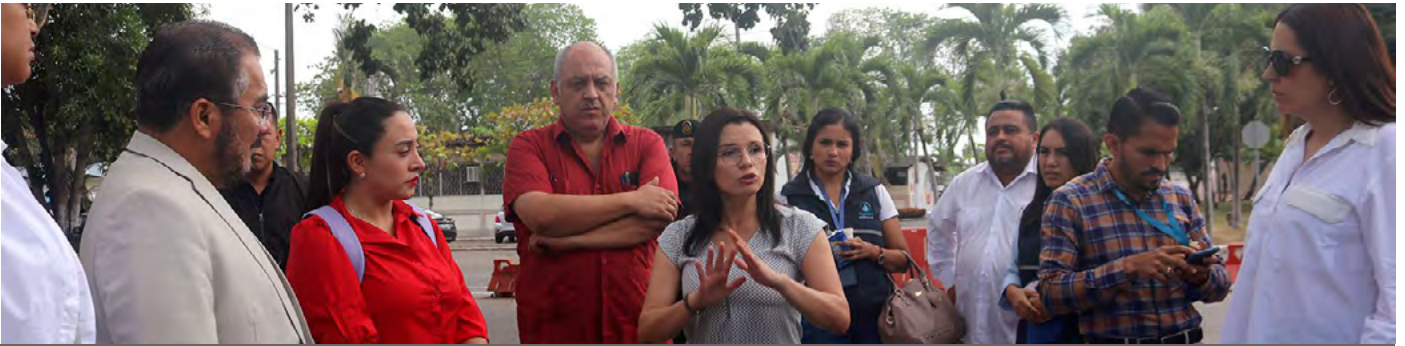
Viceministra de Seguridad, la titular de SENESCYT, gobernadora de El Oro y diversos actores locales junto a las autoridades de la UTMACH, participaron de una reunión de trabajo.

En la UTMACH se desarrolló una reunión de trabajo sobre el fortalecimiento de la seguridad ciudadana y convivencia social pacífica en las instituciones de educación superior. Nuestras autoridades participaron en esta actividad junto a la Viceministra de seguridad, la secretaria de SENESCYT, gobernadora de El Oro y diversos actores locales; en este espacio se abordó la temática principal en cuanto a la seguridad tanto en el interior como en los alrededores