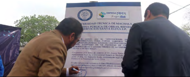
Firma de contrato entre la UTMACH y Empresa Pública de la Universidad Península de Santa Elena.