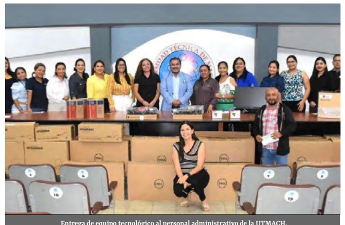
Entrega de equipo tecnológico al personal administrativo de la UTMACH.

Las autoridades universitarias junto a la Unidad de Bienes entregaron equipos tecnológicos, e insumos eléctricos al personal administrativo de la institución. El propósito es fortalecer la infraestructura tecnológica de la universidad, permitiendo a los servidores desempeñar sus funciones de manera más eficiente. La inversión en tecnología refleja el compromiso de la UTMACH con la excelencia en la educación y la gestión universitaria.