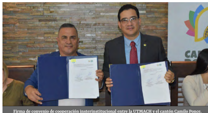
Firma de convenio de cooperación interinstitucional entre la UTMACH y el cantón Camilo Ponce.