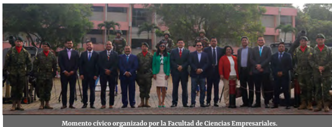
Momento cívico organizado por la Facultad de Ciencias Empresariales.

Una Ceremonia Militar se desarrolló en las instalaciones de la UTMACH con motivo del “Momento Cívico”; acto en el que participaron las autoridades principales de la academia, personal militar, docentes, servidores y estudiantes.