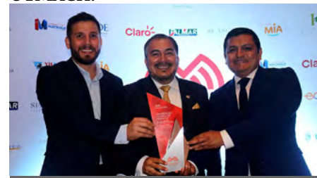
Docentes de la UTMACH participaron de evento Machala Empresarial.