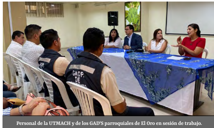
Personal de la UTMACH y de los GAD'S parroquiales de El Oro en sesión de trabajo.

participes de los entrenamientos que se dictan por la Federación Internacional de Asociaciones de Estudiantes de Medicina - IFMSA (International Federation of Medical Students Associations).