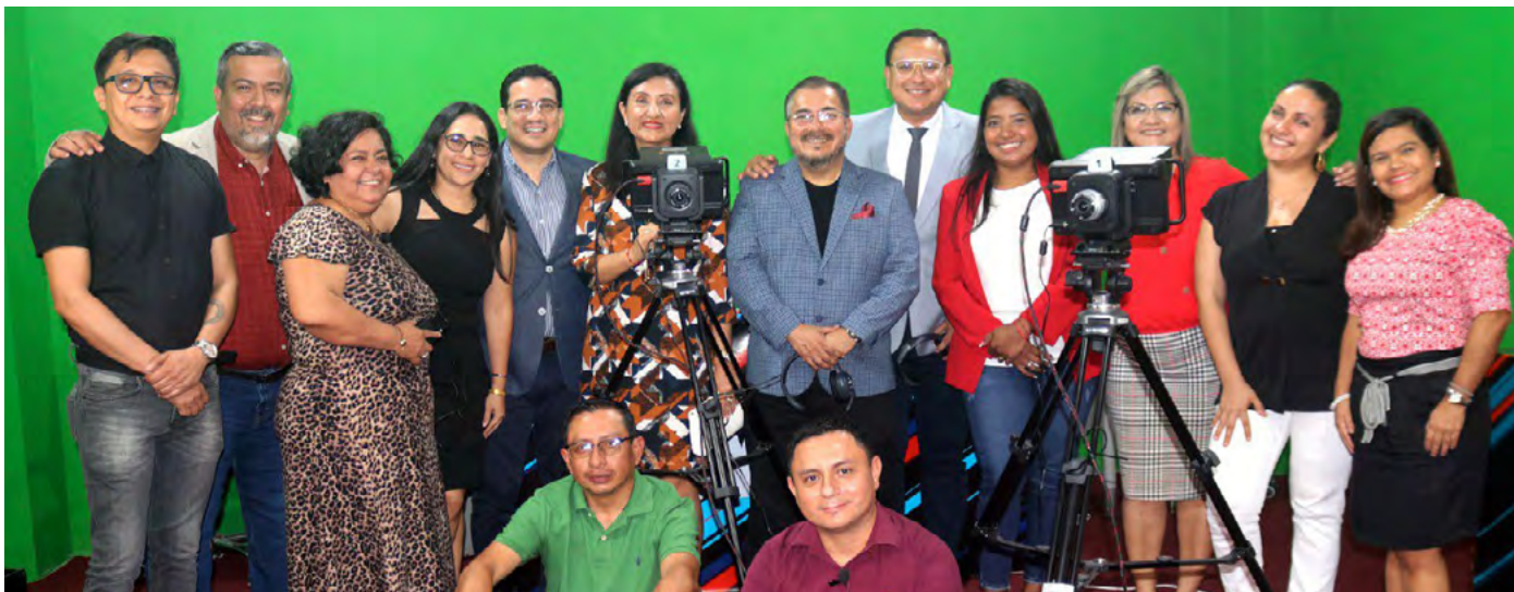
Autoridades y carrera de Comunicación de la UTMACH inauguraron laboratorio audiovisual.