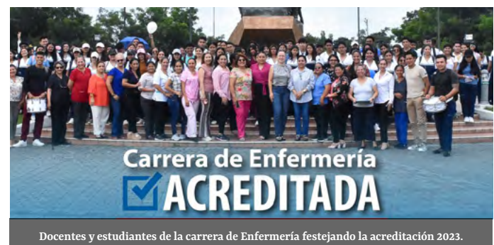
Docentes y estudiantes de la carrera de Enfermería festejando la acreditación 2023.

El CACES notificó oficialmente la Resolución sobre la acreditación de la Carrera de Enfermería. Lo logramos! La UTMACH avanza en la acreditación de otras carreras para beneficio de la comunidad estudiantil y sociedad orense.