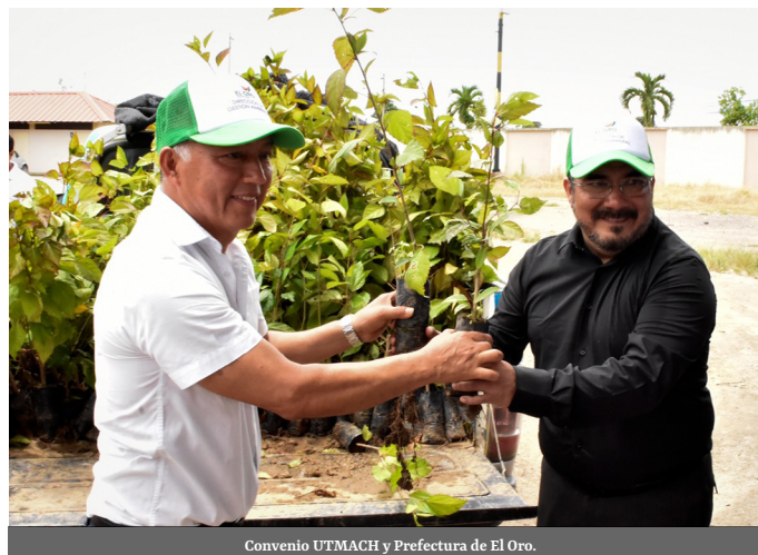
Convenio UTMACH y Prefectura de El Oro.

Mediante el convenio entre la UTMACH y Prefectura de El Oro se sembrarán más de 1500 guayacanes en los predios universitarios. Este proyecto se enmarca en el objetivo de desarrollo sostenible de la UNESCO, que está enfocado en la lucha contra la desertificación y la degradación de las tierras para detener la pérdida de la biodiversidad. Nuestra principal autoridad señaló que este trabajo en equipo permite incentivar y crear una cultura ambiental en nuestros estudiantes para el cuidado de nuestro planeta.