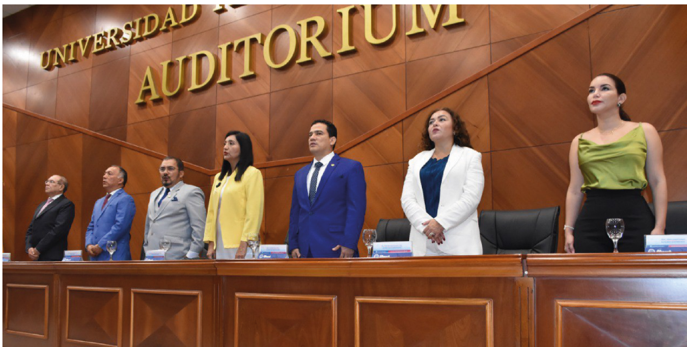
Sesión solemne por los 54 años de vida institucional.