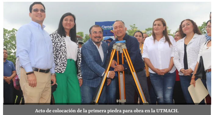
Acto de colocación de la primera piedra para obra en la UTMACH.

La UTMACH y Prefectura de El Oro realizaron el acto de colocación de la primera piedra para la construcción de la cancha de césped sintético, que se realizará junto al coliseo universitario. Ambas autoridades resaltaron su compromiso de seguir trabajando responsablemente en beneficio de toda la comunidad universitaria y provincia de El Oro.