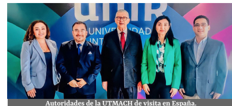
Autoridades de la UTMACH de visita en España.