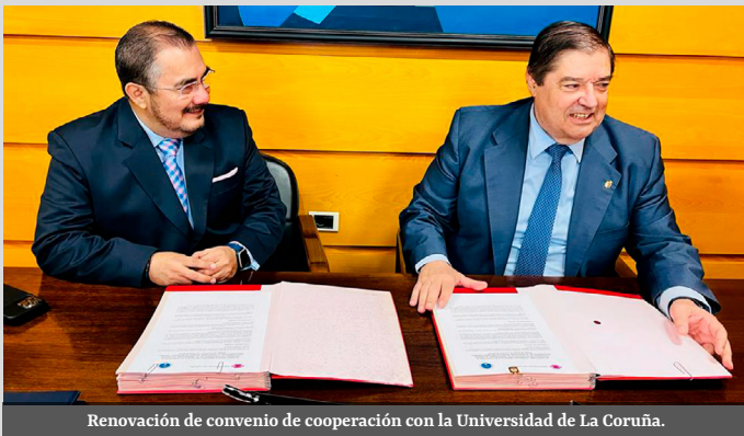
Renovación de convenio de cooperación con la Universidad de La Coruña.