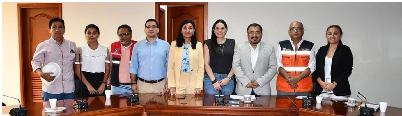
Autoridades de la UTMACH se reúnen con la SENESCYT y la Secretaría de Gestión de Riesgos.