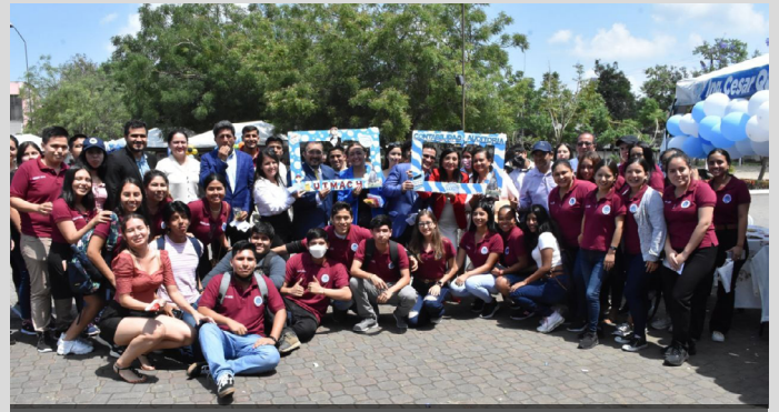
Feria de oferta académica de la Universidad Técnica de Machala.

Con la participación de las cinco Facultades de nuestra UTMACH se dio a conocer la Oferta Académica a estudiantes de los diferentes colegios que se dieron cita en la Plazoleta de los Mártires. Los estudiantes bachilleres fueron recibidos en un acto inaugural por las autoridades quienes resaltaron el compromiso y trabajo en equipo para seguir construyendo la Universidad del Futuro.