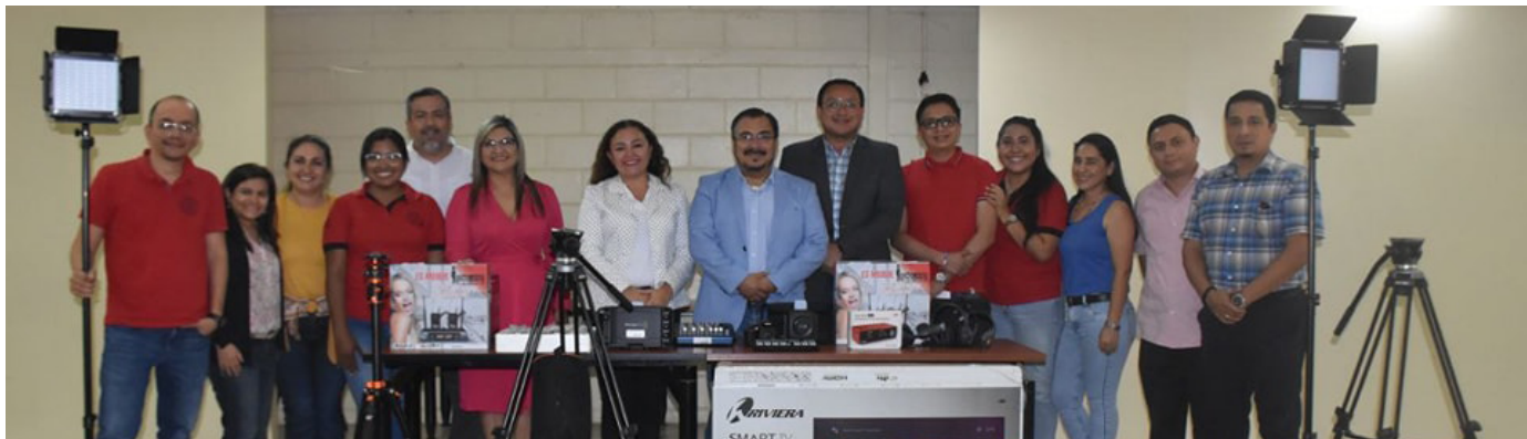
Autoridades realizan entrega de equipos audiovisuales de laboratorio, para la carrera de Comunicación de la Facultad de Ciencias Sociales.