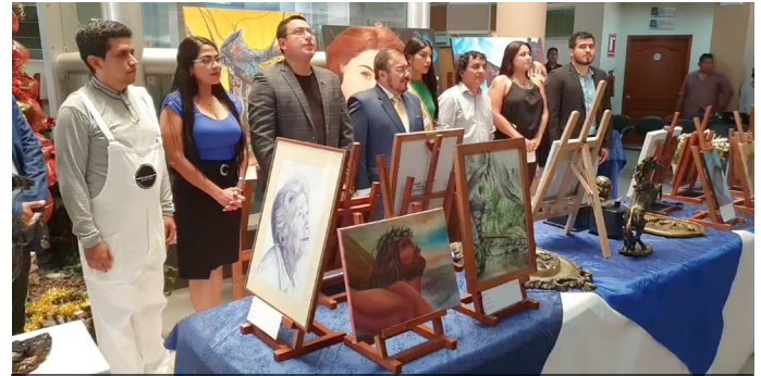
Exposición de cuadros artísticos de estudiantes graduados en el período 2022.

Los graduados de la carrera de Artes Plásticas presentaron una exposición de cuadros artísticos en el Edificio Central de la UTMACH, donde lucieron sus habilidades y talentos artísticos en escultura, pintura y dibujo.