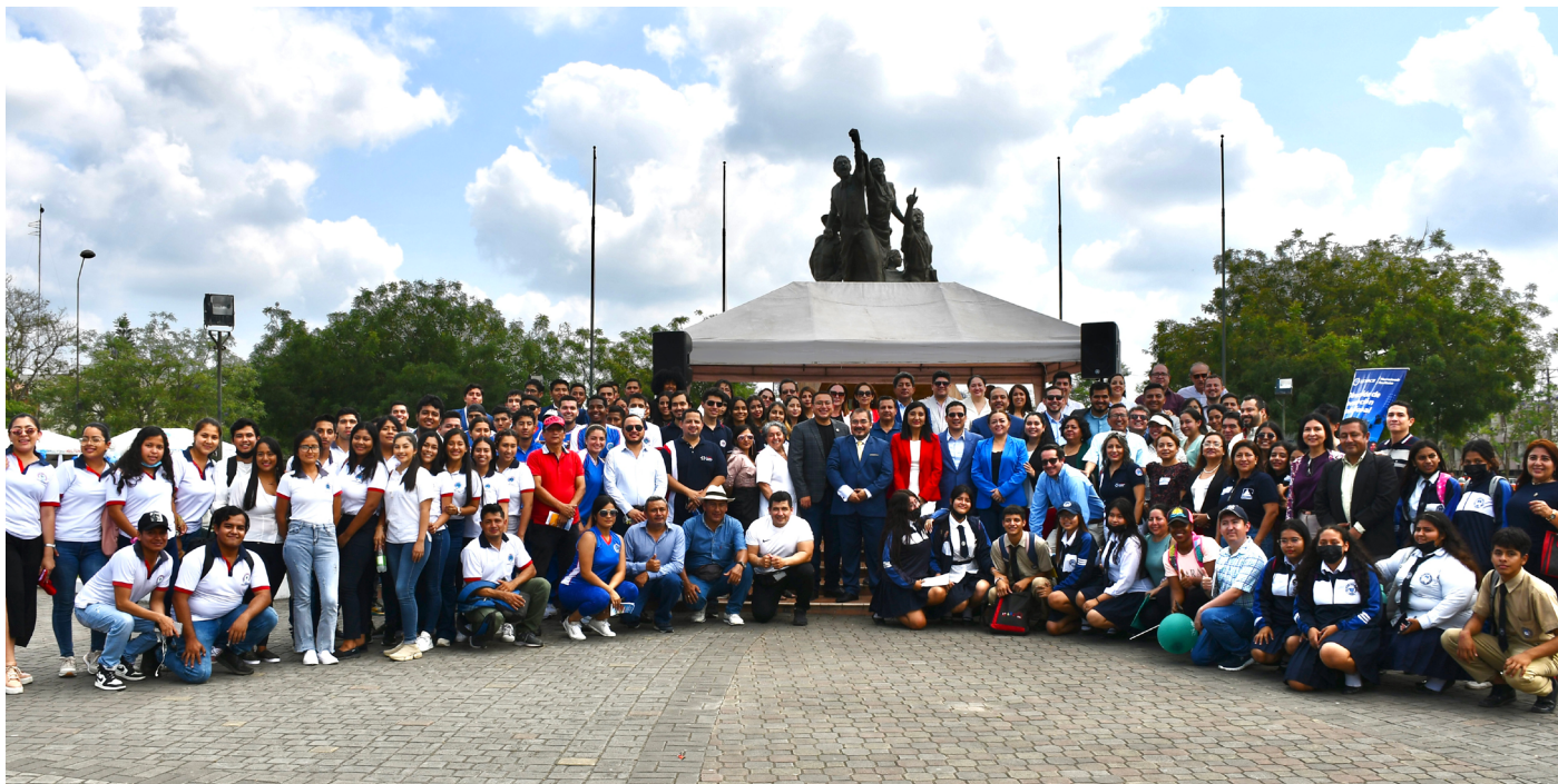
Autoridades, docentes y estudiantes en la Feria de Oferta Académica "UTMACH de Puertas Abiertas"