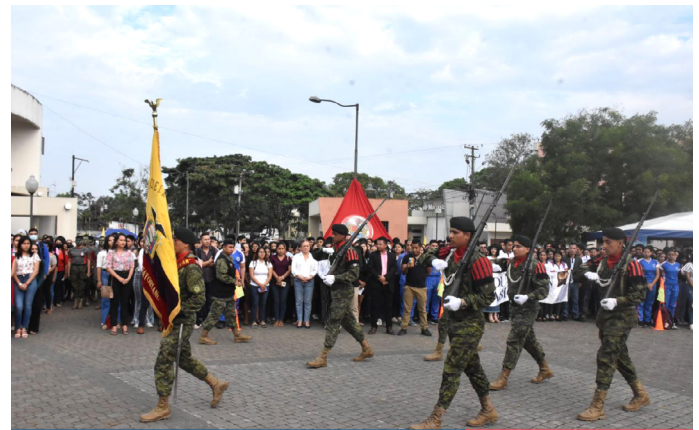
UTMACH inicia "Momento Cívico" en la comunidad universitaria, a partir de enero 2023.

En el mes de enero se iniciaron las jornadas de “Momento Cívico”, una iniciativa que surgió desde el Rectorado para fortalecer los valores cívicos de la comunidad universitaria. El programa fue organizado por la Facultad de Ciencias Sociales, con el apoyo del Grupo de Artillería No. 1 “Bolívar”. Autoridades, docentes, personal administrativo, servidores y estudiantes de la UTMACH dieron realce al evento. El primer lunes de cada mes, una Facultad de nuestra Alma Máter será la encargada de ejecutar este momento solemne.