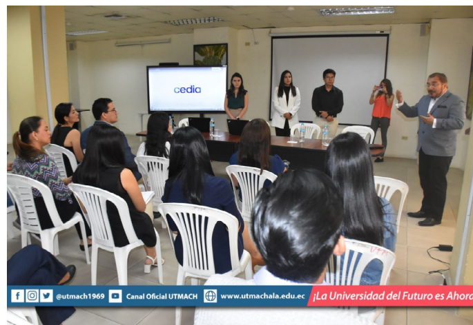
Personal de CEDIA ofreció charla para aprovechar productos y servicios que brindan.

Nuestras autoridades y representantes de la Corporación Ecuatoriana para el Desarrollo de la Investigación y la Academia se reunieron el pasado 12 de enero para conocer los productos y servicios que ofrece CEDIA, como fondos concursables y procesos de transferencias de tecnologías, entre otros. Los delegados de Cedia explicaron como hacer uso de los diversos servicios y aprovechar los fondos para uso de la investigación.