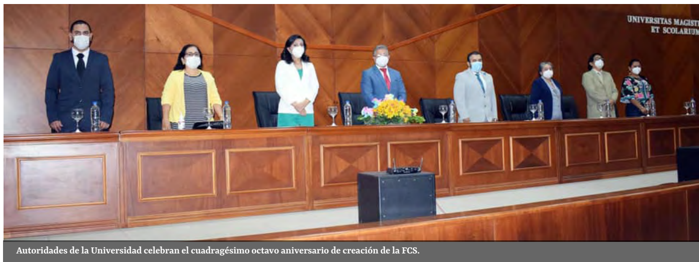
Autoridades de la Universidad celebran el cuadragésimo octavo aniversario de creación de la FCS.