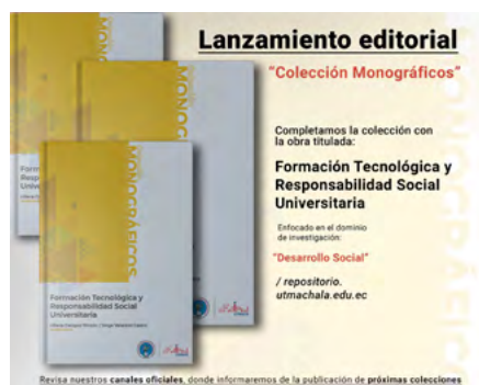
Quinto libro de la colección Monográficos.