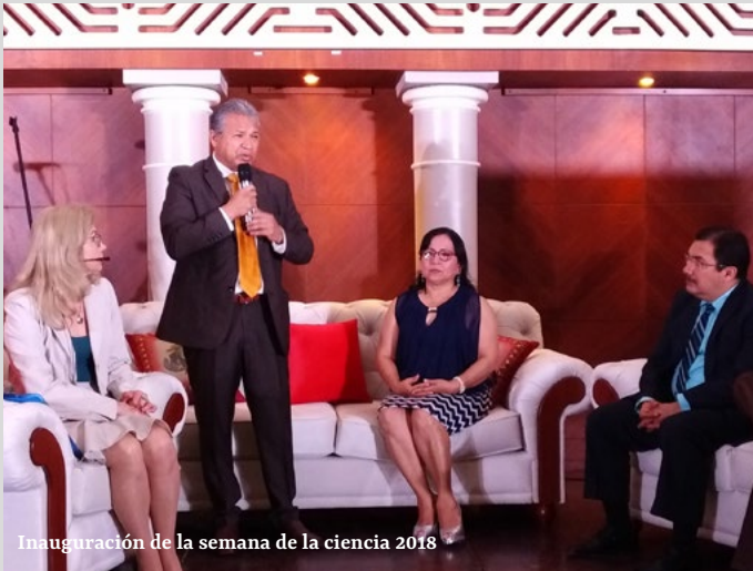
Inauguración de la semana de la ciencia 2018

La Universidad Técnica de Machala, a través de la Dirección de Investigación, trabaja en la organización de la Segunda Edición de la Semana de la Ciencia, el cual tendrá lugar en las instalaciones de la Utmach, del 28 al 30 de octubre. En este espacio, nuestra alma máter invita a la comunidad académica, Nacional e Internacional, a participar de este macroevento, diseñado para impulsar la ciencia, la tecnología y las humanidades, a través de la presentación simultánea de investigadores vinculados a los dominios científicos y líneas de investigación institucional.