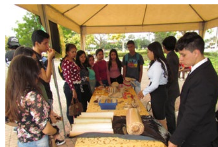
Exposición de proyectos de semilleros de investigación.

En este año 2020 la Dirección de Investigación abrirá una nueva convocatoria de Grupos y Semilleros, lo que permitirá potenciar la investigación científica en nuestra comunidad universitaria.