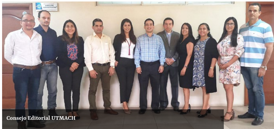
Consejo Editorial UTMACH